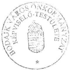
Wurczinger Lóránt polgármester