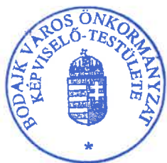
Wurzinger Lóránt polgármester