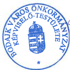
Wurczinger Lóránt polgármester